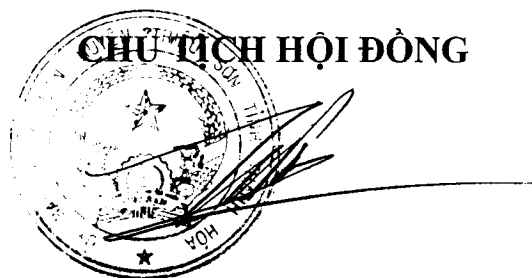
PHÓ CHỦ TỊCH UBND HUYỆN Hồ Trường Sơn